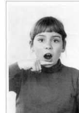
Das "A" als Geheimzeichen