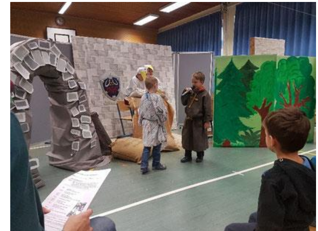
Theateraufführung: Jedes Kind bekommt eine Sprechrolle!